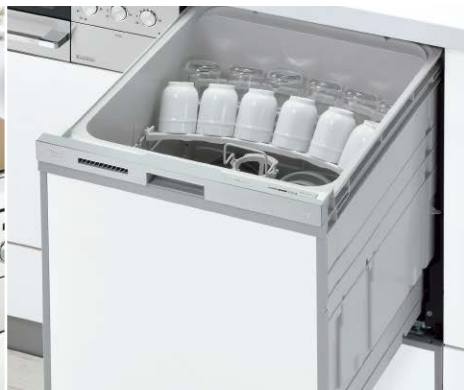
ビルトイン食器洗機