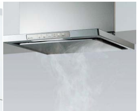
掃除しやすいレンジフード