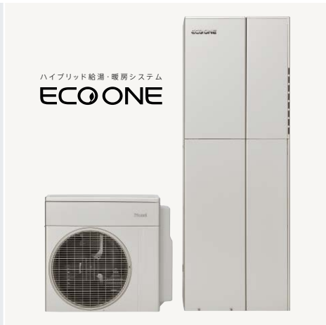
ハイブリッド給湯器 ECO ONE