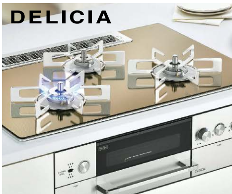
ビルトイン自動調理対応コンロ