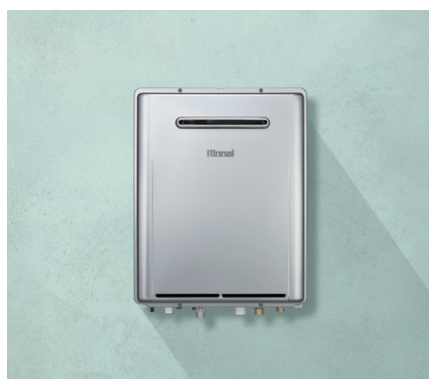
ガス給湯器 ecoジョブ