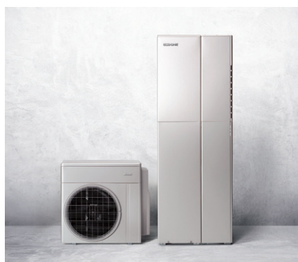
ハイブリッド給湯器