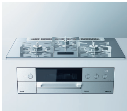
ビルトインコンロ