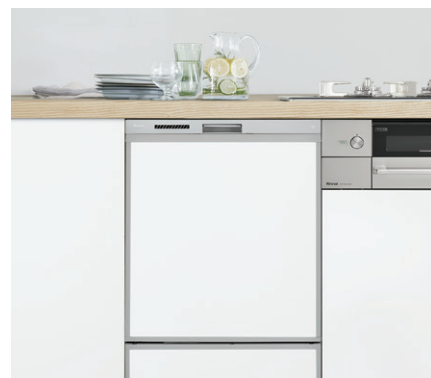
ビルトイン食器洗い乾燥機