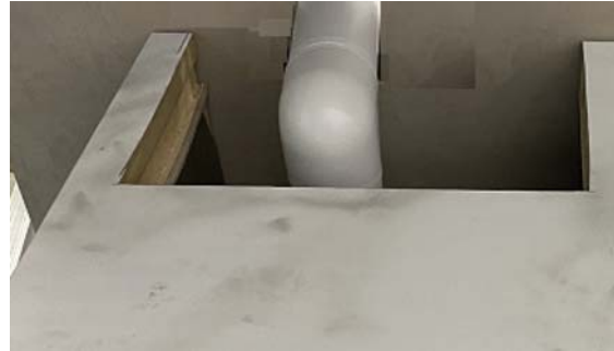
参考：天板切欠き (※排湿管カバーの取付は任意です)